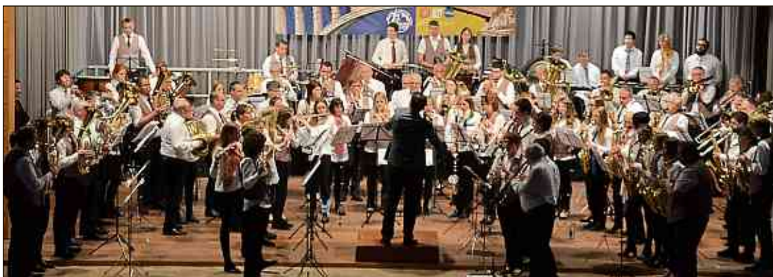
Beim gemeinsame Concert am Schwarzwald stoungen iwwer 100 Musikanten op der Bühn.

D'Mierscher Musek op Besuch bei hire Frënn vu Forbach