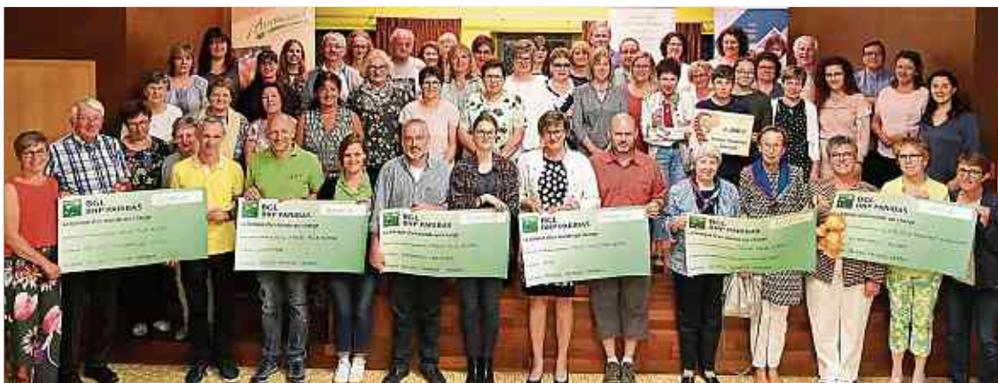
Mehr als 25 000 Euro vermochten die Jeunes Mamans zu spenden.

Jeunes Mamans verteilen Erlös des Secondhandshops an sechs Hilfsorganisationen